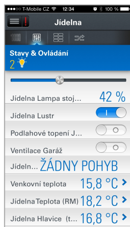
Ovládání světel a spotřebičů

Pro zařízení, jako je Smart-TV nebo PC , případně smartphony s jiným operačním systémem, se ke Smart Manageru připojíte přes internetový prohlížeč.