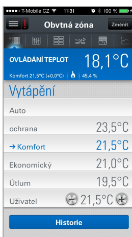
Nastavení parametrů vytápění