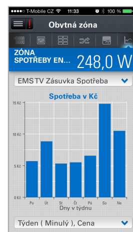
Spotřeba energií pod kontrolou

Více informací o chytré elektroinstalaci na: www.xcomfort.cz