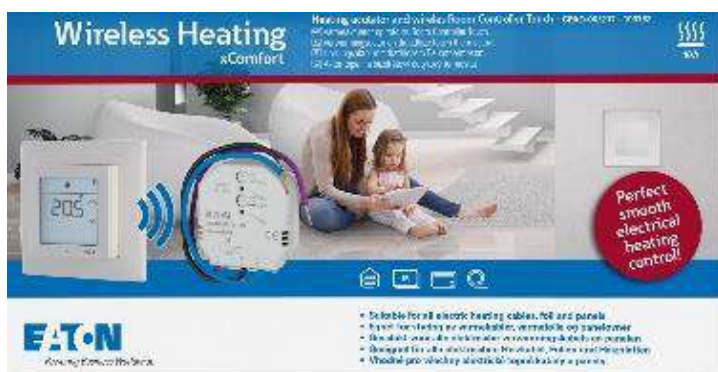
KOMPLET = CPAD-00/217 (193732)

Nejčastěji se instaluje nalepením na stěnu bez nutnosti použití instalační krabice. Pokud bude ale využito externí napájení nebo připojení externího senzoru PT1000, je zapotřebí instalační krabice o průměru 68 mm. Standardně je termostat napájen dvěma bateriemi AAA, které jsou součástí balení. Výhodou je rovněž možnost externího napájení z centrálního zdroje CMMZ-00/13. Vestavěný USB konektor slouží pro softwarový update anebo rovněž pro napájení. Termostat je vyráběn v šesti barvách středových krytů - lesklá bílá, zářivě bílá, alpská bílá, signální bílá, matná antracitová a černá. Přístroj není závislý na konkrétním výrobcí rámečku, barvě či materiálu - s výhodou je možné vybrat z mnoha doporučených výrobců rámečků se středovým otvorem 55x55 mm.