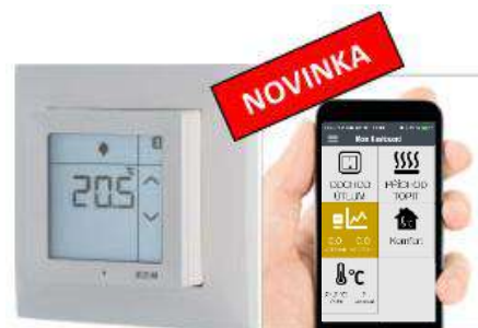
KOMPLET = CPAD-00/198 (187712) Rámeček EATON 55x55 mm, lesklá bílá

Bezdrátový termostat s dotykovým displejem RF systému EATON xComfort je vybavený vnitřním senzorem teploty, vlhkosti a intenzity a časovými plány. Proto je ideálním řešením pro regulaci vytápění a chlazení, příp. jen pro monitorování klimatu v místnosti. Termostat má externí vstup PT1000 pro připojení senzoru CSEZ-01/36 pro měření venkovní teploty nebo regulaci elektrického podlahového vytápění s omezením max. podlahové teploty (při přímém řízení rovněž min. teploty podlahy). Termostat trvale zobrazuje teplotu v místnosti a při doteku rovněž vlhkost, čas nebo venkovní teplotu – ovšem pokud systém venkovní teplotu využívá.